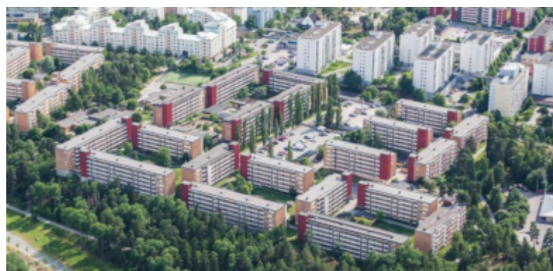
Det svenske eiendomsmarkedet gjorde et comeback i løpet av kvartalet, D. Carnegie var blant de beste bidragsyterne. Foto: D. Carnegie

SKAGEN m2 vil fortsette å investere i selskaper med en innebygget vekstmodell som er mindre påvirket av endringer i avkastningskrav. Det er fortsatt potensial for høyere leieinntekter i flere selskaper, hvis man ser på hva de tar i leie nå i forhold til hva som er markedsrenten. Forskjellen på verdsettelsen av fysisk eiendom og børsnoterte eiendomsselskaper er fortsatt stor, noe som indikerer at vi vil se flere oppkjøp og sammenslåinger av børsnoterte selskaper i løpet av året.